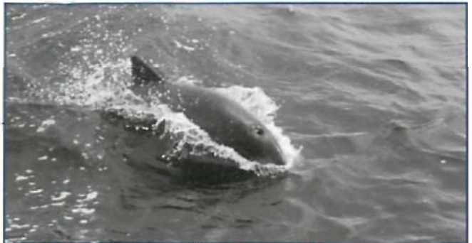
nordwestlich vor Rügen

Beim Akustischen Monitoring werden die von Schweinswalen zur Orientierung ausgesendeten Schallimpulse von Klickdetektoren (Unterwassermikrofonen) aufgezeichnet. Auch SAMBAH, ein internationales Projekt aller EU-Ostseeanrainerstaaten, nutzt diese Technik, um Daten zur absoluten Zahl und Populationsdichte der Schweinswale im gesamten Ostseeraum zu erheben.